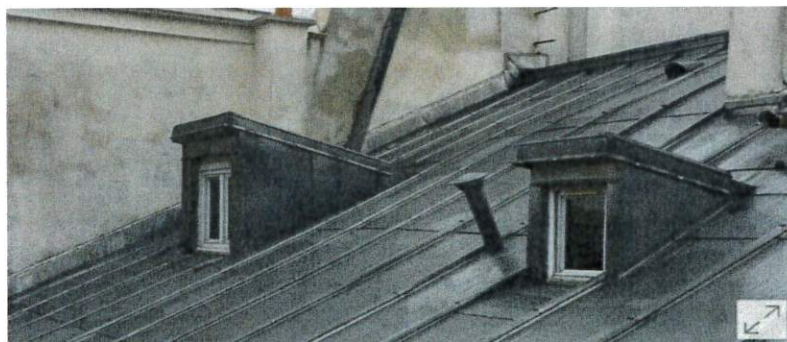
Le chien-assis est un type de lucarne que l'on peut régulièrement observer sur les immeubles parisiens. Il équipe aussi bien des parties communes que des "chambres de bonne".

Page 19 point g : chiens-assis présents sur de nombreuses constructions, confusion avec lucarnes