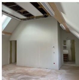
Classe des grands