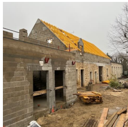
Charpente en partie posée